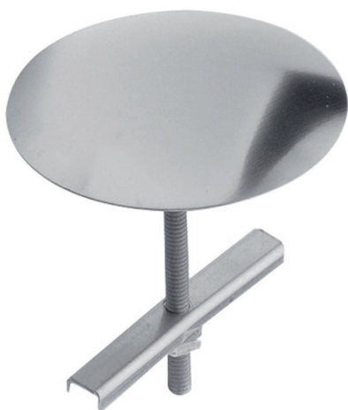
P. Cobre Agujero