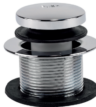
Rejilla Pulsador Tina